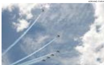
Esquadrilha da Fumaça encanta paranaibenses e visitantes

Sete aviões da FAB (Força Aérea Brasileira) foram responsáveis pela diversão do público que compareceu ao encerramento da 1ª Expedi-